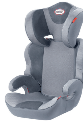
MaxiProtect ERGO SP