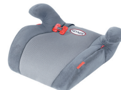
SafeUp M ERGO

In unterschiedlichen Farben erhältlich. In different colors available. Имеется в продаже разного цвета.