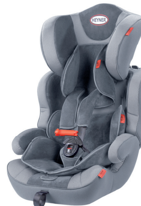
MultiProtect ERGO SP