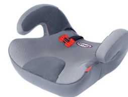
SafeUp L ERGO